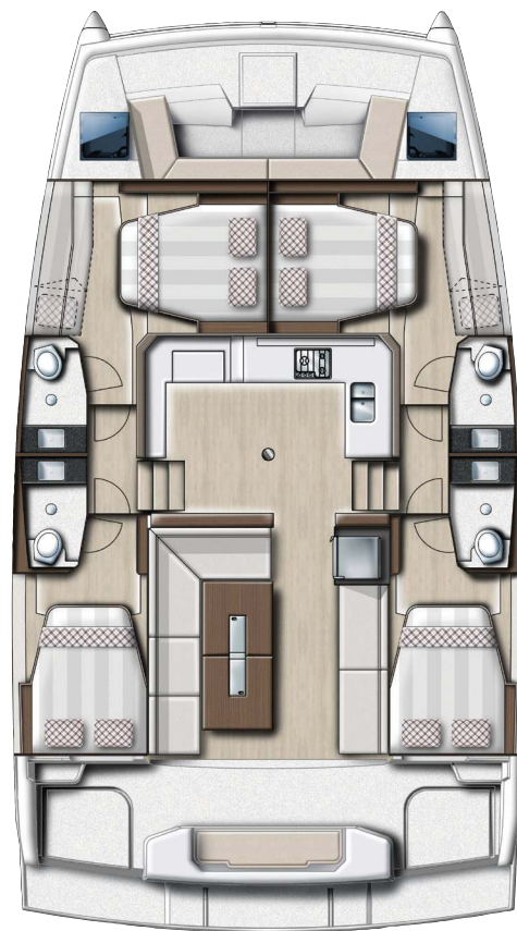
4 cabins family version Version 4 cabines family