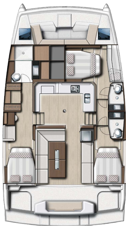
3 cabins Owner's version Version 3 cabines propriétaire