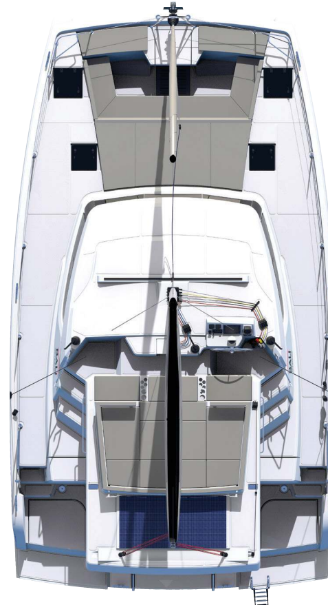
Deck and Flybridge Pont et flybridge