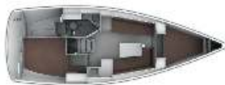
Basispaket / Basic package