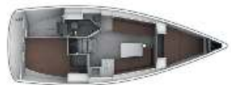
Easy Living Paket / Easy Living package